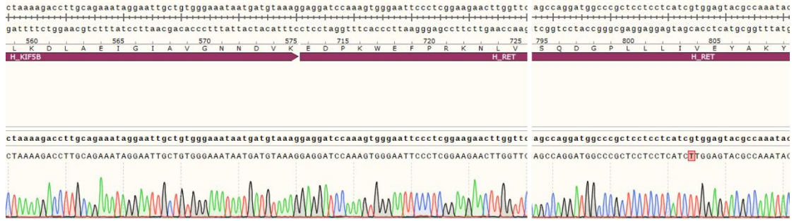
Fig 2. H_KIF5B-RET(V804L) BaF3 Cell Line 测序结果